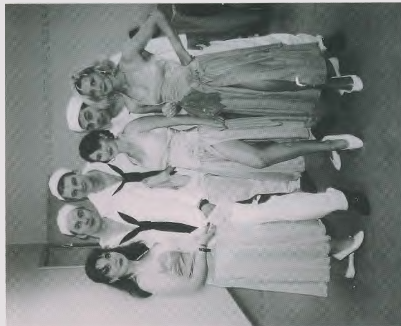
„Die Jitterbug’s“ vierfache Weltmeister im Boogie-Woogie und Swing-Tanz, amtierende Europameister im Rock’n Roll der 50er-Jahre